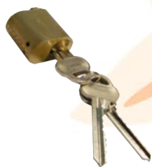
Cylinder med nycklar Blank/Mässing

Obehandlad dörr med spårfräst utsida, slät insida, täckmålning rekommenderas.