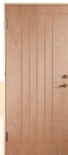
EK40 Obehandlad, tät 8x19/9x20