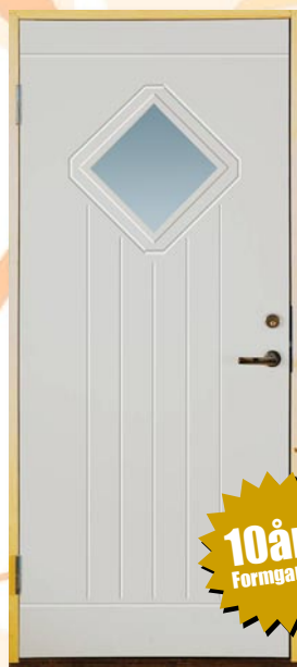
EK54G Grundmålad, klarglas 8x19/9x20