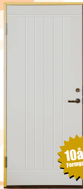
EK54 Grundmålad, tät 9x20/10x21