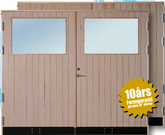
S18G GP/S18 GP Obehandlad Spårfräst utsida, slät insida. 18° varmförrådsdörr