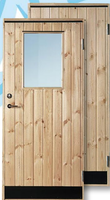
R10 Furupanel Obehandlad furupanel, insida plywood. 10° kallförrådsdörr Lackas eller laseras