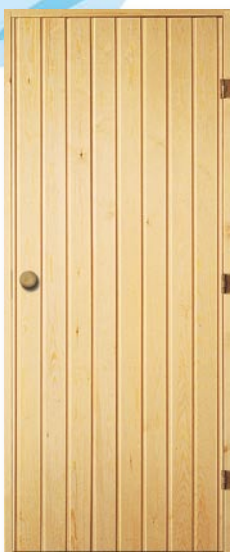
BDP Bastudörr i obehandlad granpanel