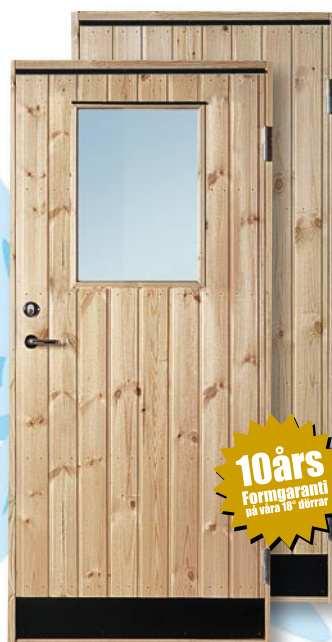
F18 Furupanel Obehandlad furupanel, insida plywood. 18° varmförrådsdörr Lackas eller laseras