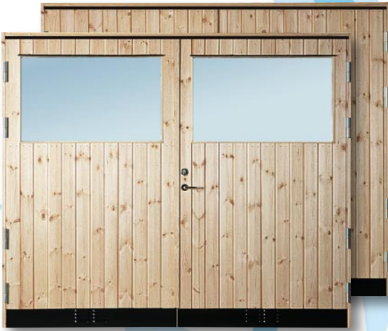
R10G GP/R10 GP Furupanel Obehandlad furupanel, insida plywood. 10° kallförrådsdörr