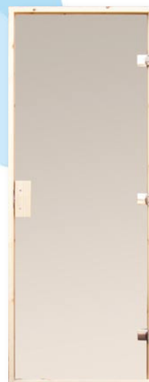
BD1G Bastudörr med säkerhetsglas