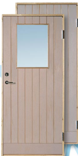
SR10 Obehandlad Spårfräst utsida, slät insida. 10° kallförrådsdörr Täckmålas eller laseras