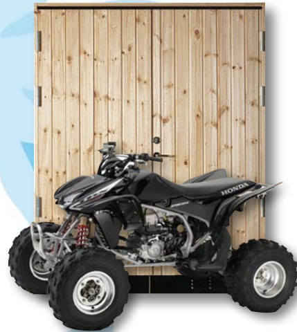
R10 GP 15x20 Furupanel Obehandlad furupanel. Perfekt till gräsklippare 4-hjuling eller snöskoter.