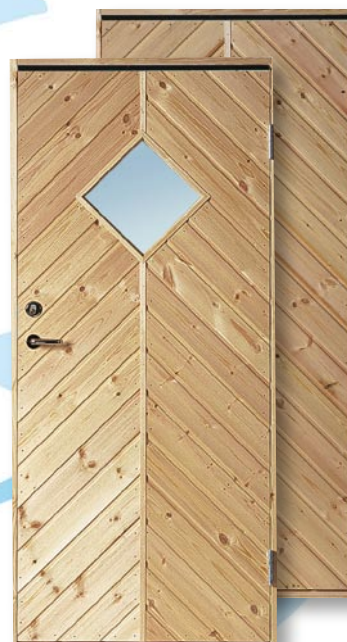
F10 Furupanel Obehandlad furupanel, insida plywood. 10° kallförrådsdörr Lackas eller laseras