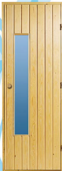
BDGP Bastudörr i obehandlad granpanel