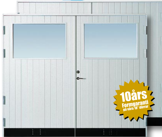
S18G GP/S18 GP Vitmålad Spårfräst utsida, slät insida. 18° varmförrådsdörr