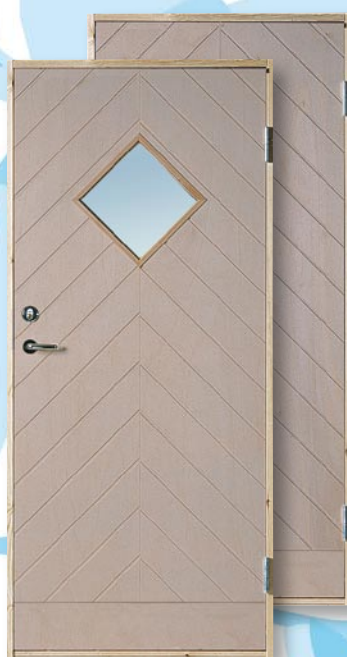
SF10 Obehandlad Spårfräst utsida, slät insida. 10° kallförrådsdörr Täckmålas eller laseras